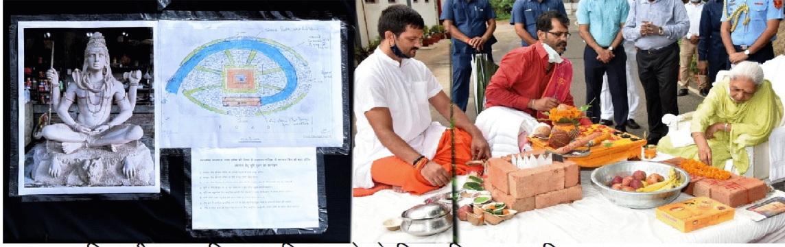
भगवान शिव की भव्य प्रतिमा स्थापित कराने के लिए भूमि पूजन व शिलान्यास