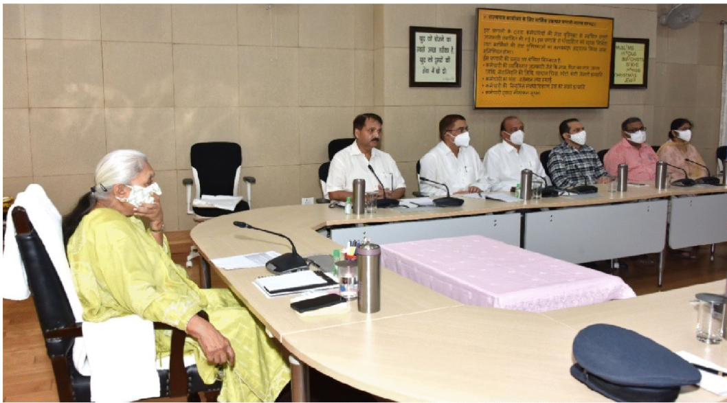
राजभवन में आठ साफ्टवेयर प्रणालियों का लोकार्पण