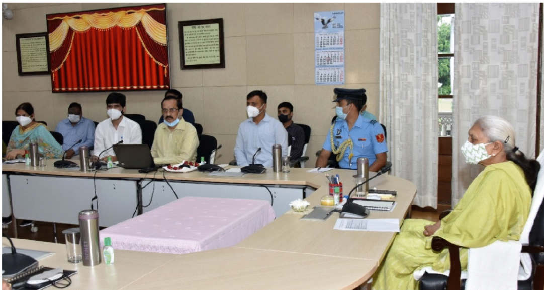
राजभवन में आठ साफ्टवेयर प्रणालियों का लोकार्पण