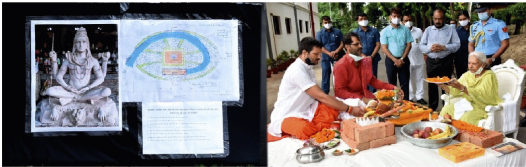
भगवान शिव की भव्य प्रतिमा स्थापित कराने के लिए भूमि पूजन व शिलान्यास