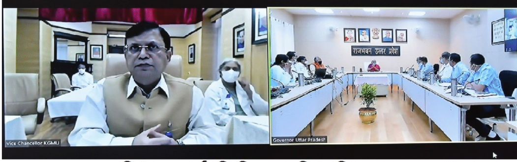
किंग जार्ज चिकित्सा विश्वविद्यालय