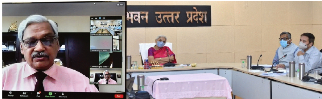
अटल बिहारी वाजपेयी चिकित्सा विश्वविद्यालय