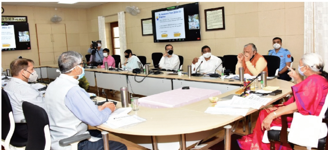
किंग जार्ज चिकित्सा विश्वविद्यालय