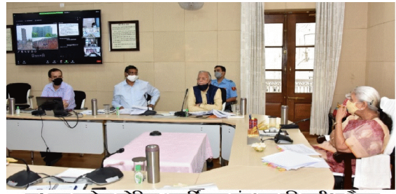
डा0 राम मनोहर लोहिया आर्युर्विज्ञान संस्थान की समीक्षा बैठक