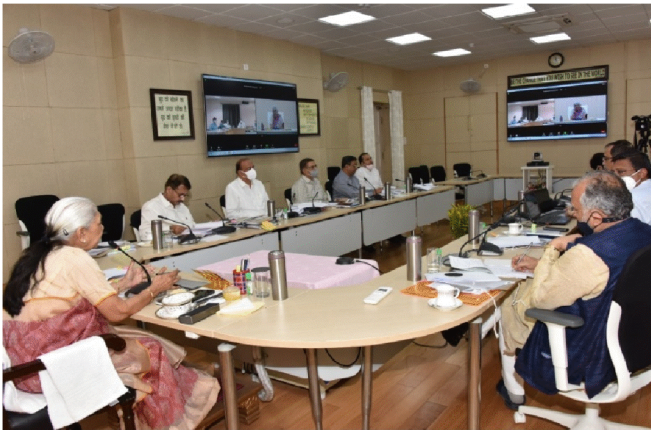
एस0जी0पी0जी0आई0 की समीक्षा बैठक