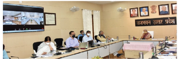
एस0जी0पी0जी0आई0 की बैठक