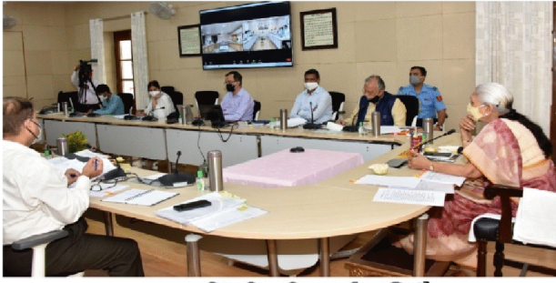
एस0जी0पी0जी0आई0 की बैठक