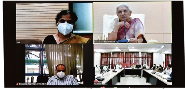
डा0 राम मनोहर लोहिया आर्युर्विज्ञान संस्थान की समीक्षा बैठक